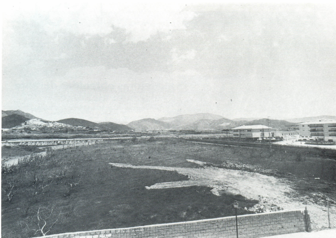
Plan de Extensión en la zona Norte. Esta foto, con apenas un año, se ha quedado totalmente anticuada. Está sacada desde una ventana del Consultorio Médico.

El Ayuntamiento, por otra parte, se ha previsto de recursos, solares, bienes muebles e inmuebles, que han elevado enormemente el patrimonio municipal.