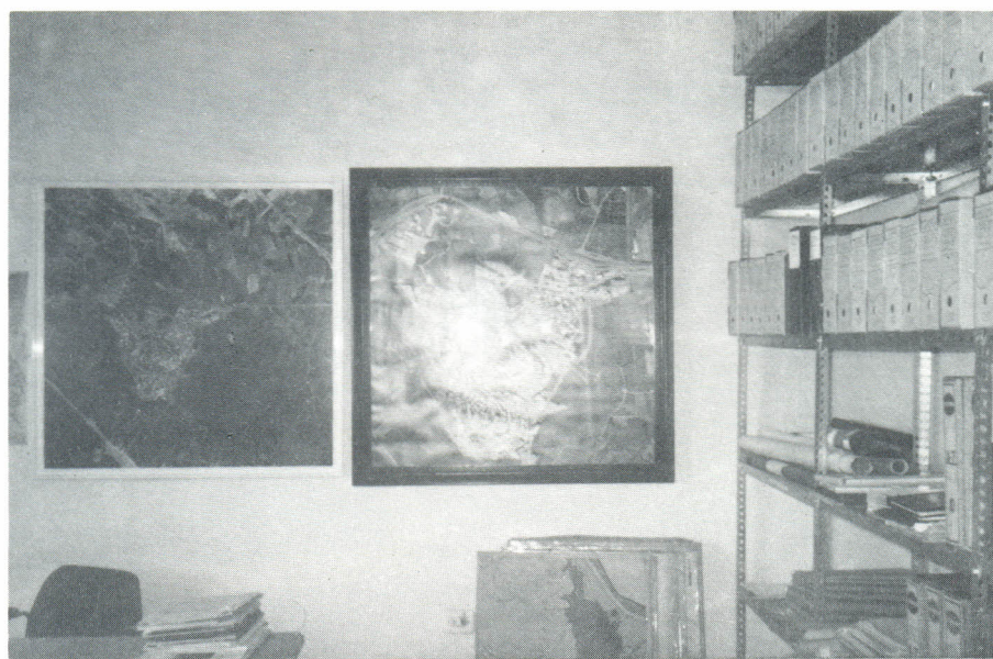
Oficina de Urbanismo en el Ayuntamiento, a la que actualmente se han sumado un arquitecto municipal.

■ Acondicionamiento de los accesos al Mercado Municipal y construcción de un nuevo mercado en La Caleta, con una inversión, esta última, de un millón de pesetas.