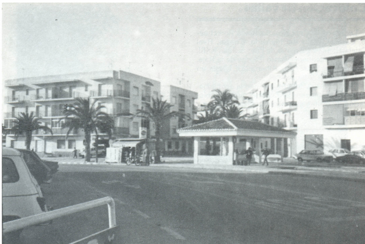
Acceso a Salobreña y plaza de Goya.