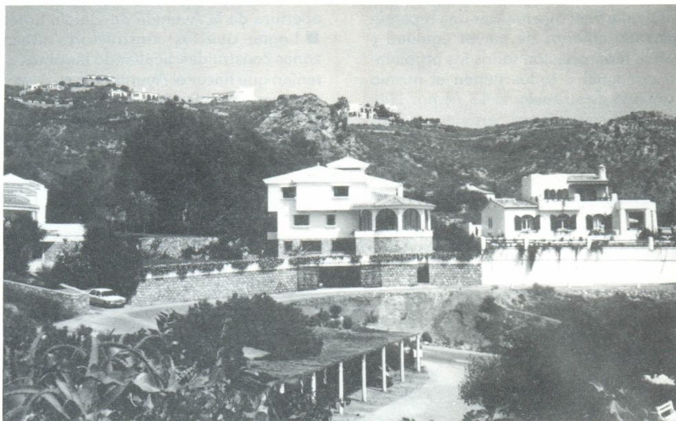
Plan Parcial Monte de los Almendros. Zona residencial de chalés.

Tampoco había en el Plan un proyecto de alineaciones y rasantes que igualara la construcción de los edificios respecto a la franja de la playa y el Paseo Marítimo. Éste se ha hecho y se ha dejado una franja de 30 metros desde el borde exterior del Paseo Marítimo hasta las construcciones más cercanas. Como fruto de estas intervenciones y planificación, las urbanizaciones se están haciendo con absoluto respeto a las normas urbanísticas.