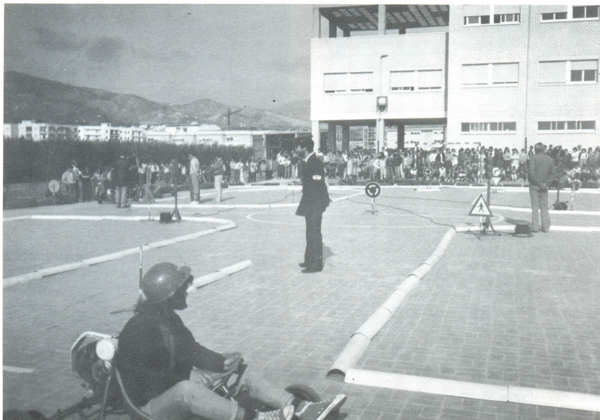
La Policía Municipal ayuda a los escolares en clases de educación vial.

■ Adquisición de dos motocicletas de 3,5 CV. Dos motos de pequeña cilindrada. Moto para encargado de obras.