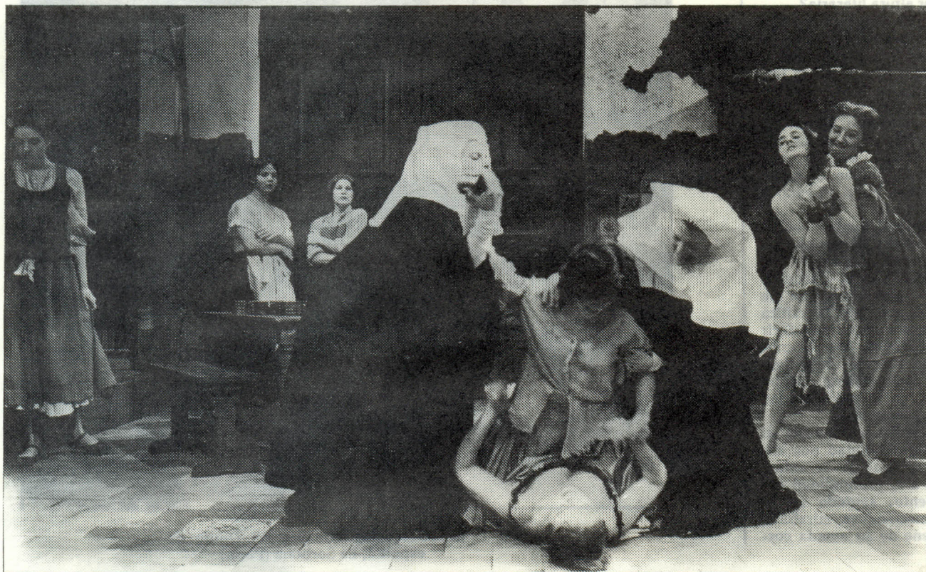
The Pennsylvania State University, "The inmates of the convent of saint Mary Egiptian" por la Resident tjeatre Company (USA)

del deseo, del misticismo, estoy devorado por amores; amor al mar, a mi Motril, a mi pueblo, al verde de sus campos, a los que viven en nuestra costa granadina, al cielo que vemos... amor..., creo que el problema de nuestro tiempo es la falta de amor".