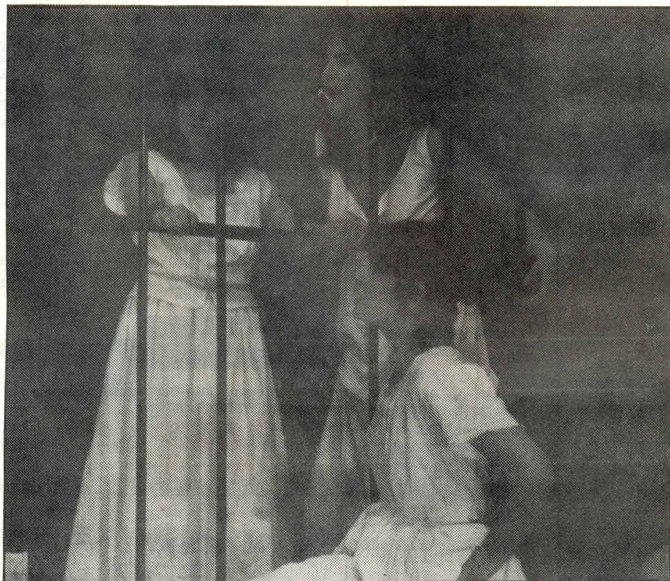
"Las Arrecogías", versión catalana, por el grupo "La barraca del pueblo seco". Barcelona

nos, de la imaginación como arma para combatir el fariseísmo y la hipocresía de políticos de nuevo cuño.