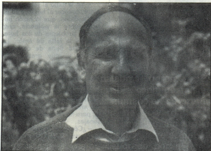
Mis personajes son violentos porque carecen de amor

Sí, una de las constantes que mantuvimos en nuestra larga entrevista, fue el amor, así como el teatro español hoy, gustos y apetencias, sueños, realidades y frustraciones... Eran las 9'30 de la noche, cuando apaciblemente sobre el cálido verano, miramos las hermosas vistas de la Salubiniya islámica, cantada por poetas y artistas. ¡Nunca habrá palabras que suplan la hermosura de su grandiosidad y belleza!