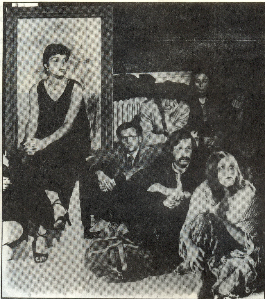
"Las Arrecogias"-Adaptación. Dptdo. de español, La Sorbona (Paris)

La charla iba entrando en su cénit, la tranquilidad nos absorbía por entero, la calma obligaba a la profundidad del pensamiento; sentado en la butaca, meciéndose, miraba al mar sereno de su amada cos-