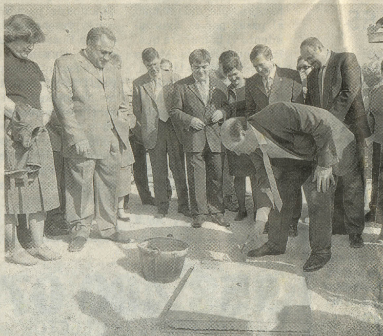
EN 2001. Rodríguez Tabasco colocó la primera piedra. /A. A.