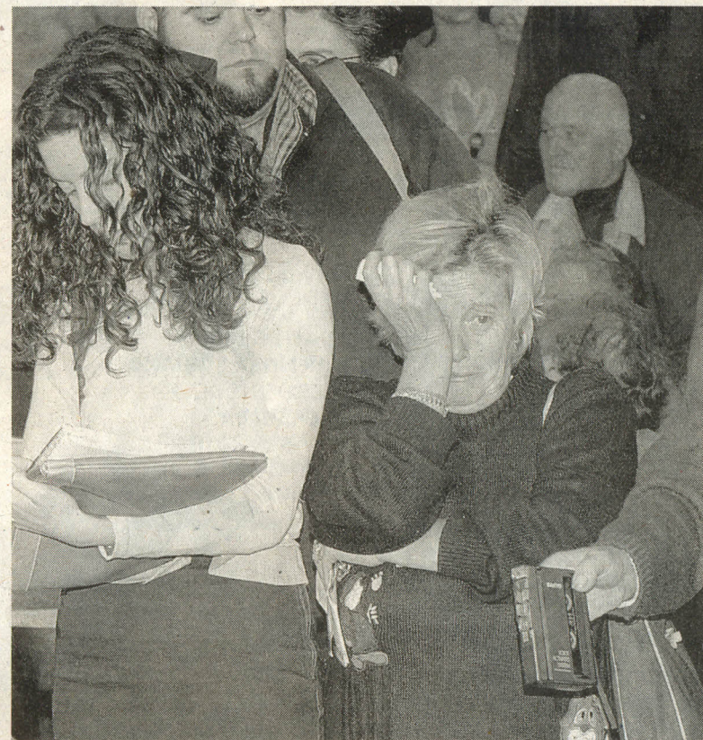
LÁGRIMAS. Una salobreñera llora en la despedida del alcalde.

La primera orden del nuevo alcalde , segundos después de jurar su cargo, fue pedir a la Policía Local que apaciguara los ánimos