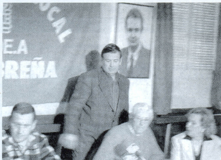
Noticia publicada en IDEAL