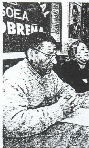
CRÍTICAS. Miembros del comité local de la Villa.