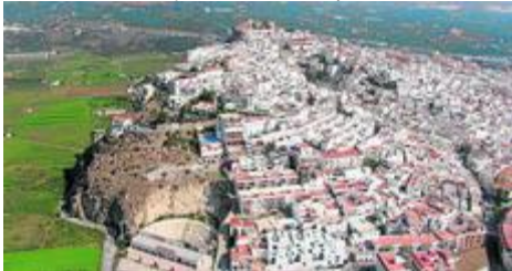
Vista aérea del casco histórico de Salobreña.

S. SEBASTIANI, SALOBREÑA | ACTUALIZADO 03.03.2010 - 05:01