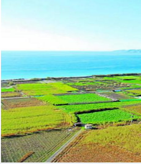
Terrenos del TH1 donde se prevé construir un hotel.

S.SEBASTIANI / MOTRIL, SALOBREÑA | ACTUALIZADO 06.07.2010 - 05:01