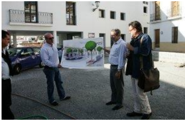
Diseño de la recuperación de la antigua plaza del Ayuntamiento, de Salobreña, a la que volverá la vida.

26.10.10 - 02:12 - FRANCISCO M. ORTEGA | SALOBREÑA