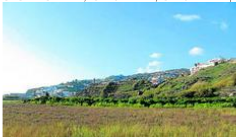
Imagen de los terrenos en los que se proyectaban las viviendas.

S. SEBASTIANI / SALOBREÑA, SALOBREÑA | ACTUALIZADO 02.08.2010 - 05:01