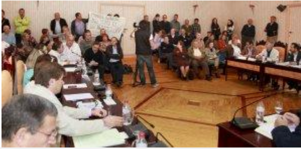
Agricultores y propietarios de suelo que se oponen al polígono industrial en La Tahíba, en el pleno que aprobó el PGOU de Salobreña.